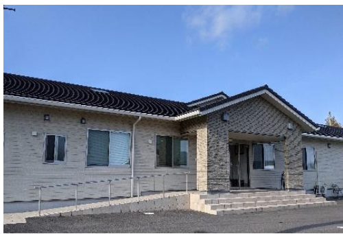
<コンサフォス川島東>

【企業名】特定非営利活動法人アイルコート 【所在地】香川県高松市 【業種】医療・福祉 【事業概要】放課後等デイサービス 就労継続支援B型・生活介護 【設立】2010年4月22日 【従業員】55名